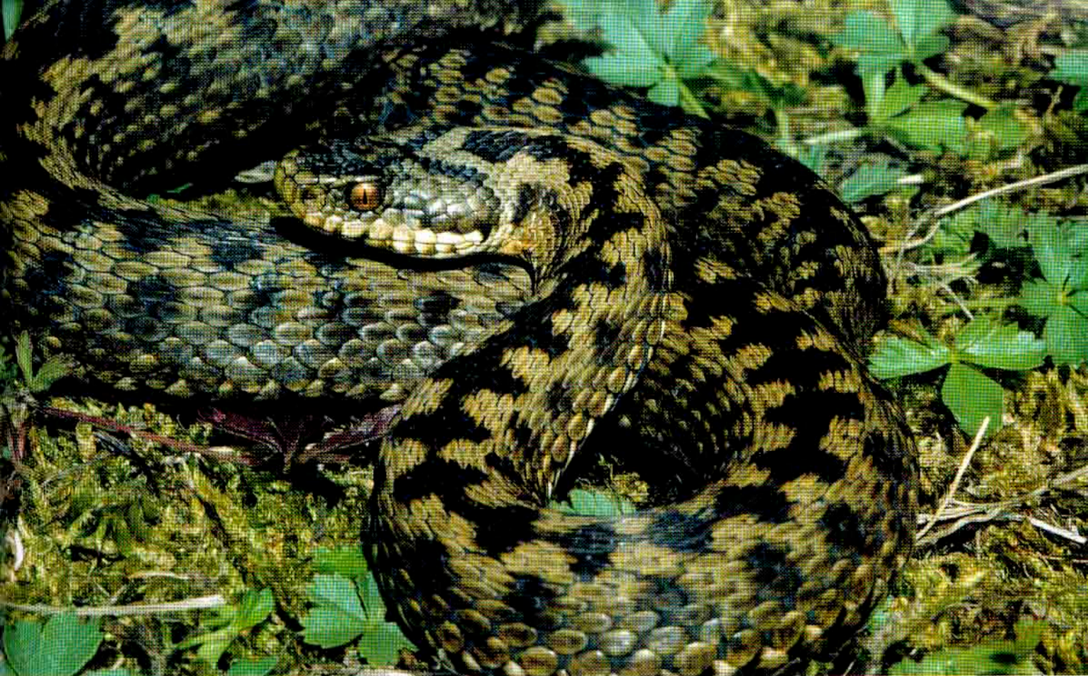
Net zoals andere reptielen is de adder een echte zonneklapper.

een giftige beet. Het gif werkt in op de bloedvaten en het zenuwstelsel van het slachtoffer.