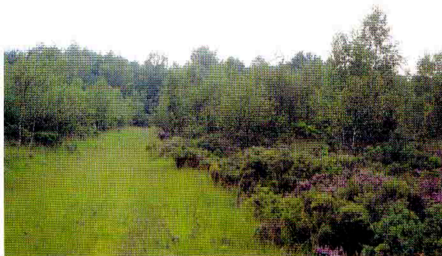
Een addergebied vertoont een afwisseling van droge en natte heide, struiken en bosranden.

Er moet dus nog heel wat gewerkt worden aan natuurontwikkeling in het voordeel van de adder. Dit is niet alleen de taak van vrijwilligers, maar ook de gemeente Lille steekt een stevig handje toe. De allerlaatste addergebieden in Vlaanderen behouden en uitbreiden behoort tot de belangrijkste doelstellingen van Natuurpunt in de Noorderkempen